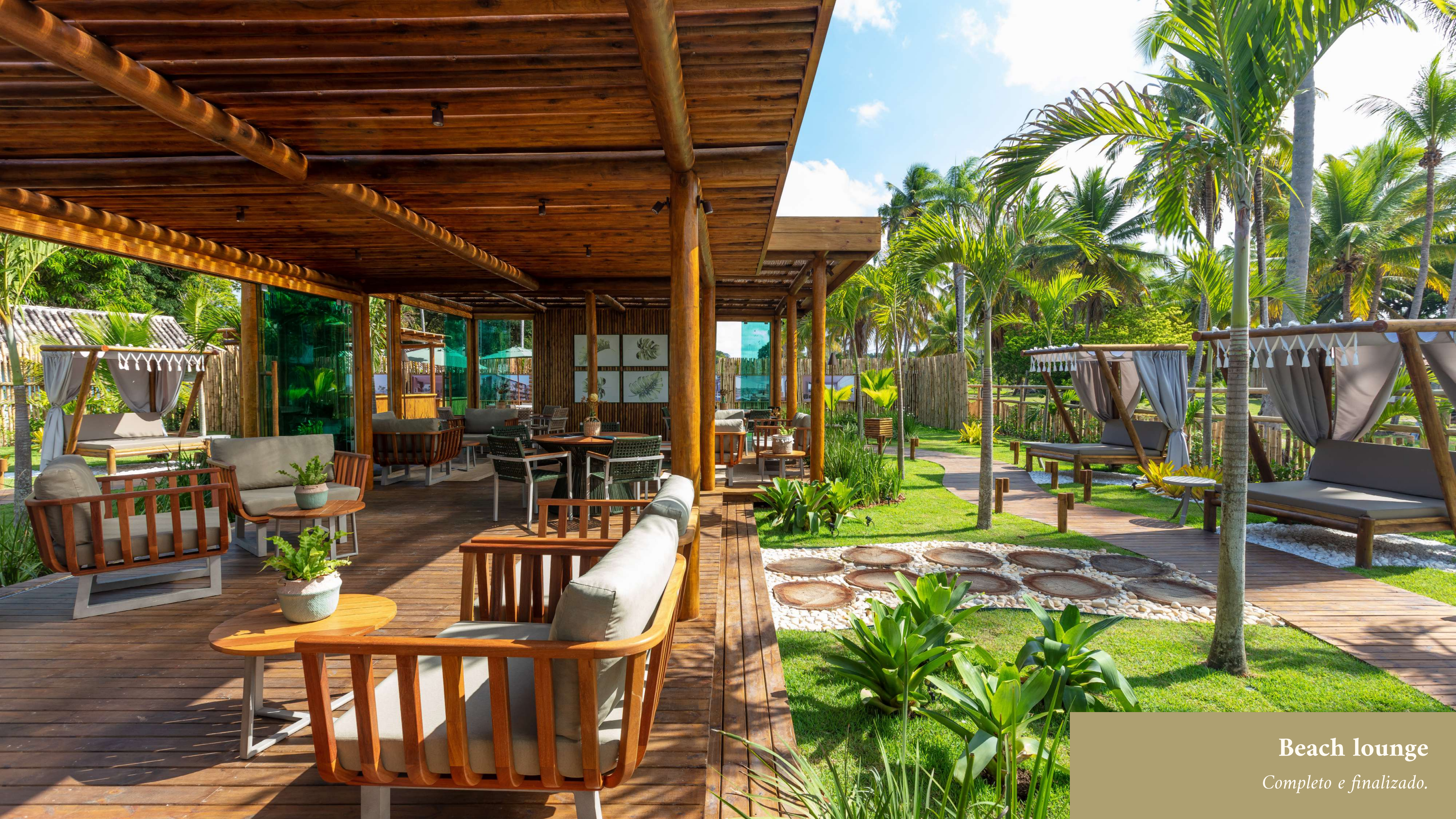
Beach lounge Completo e finalizado.