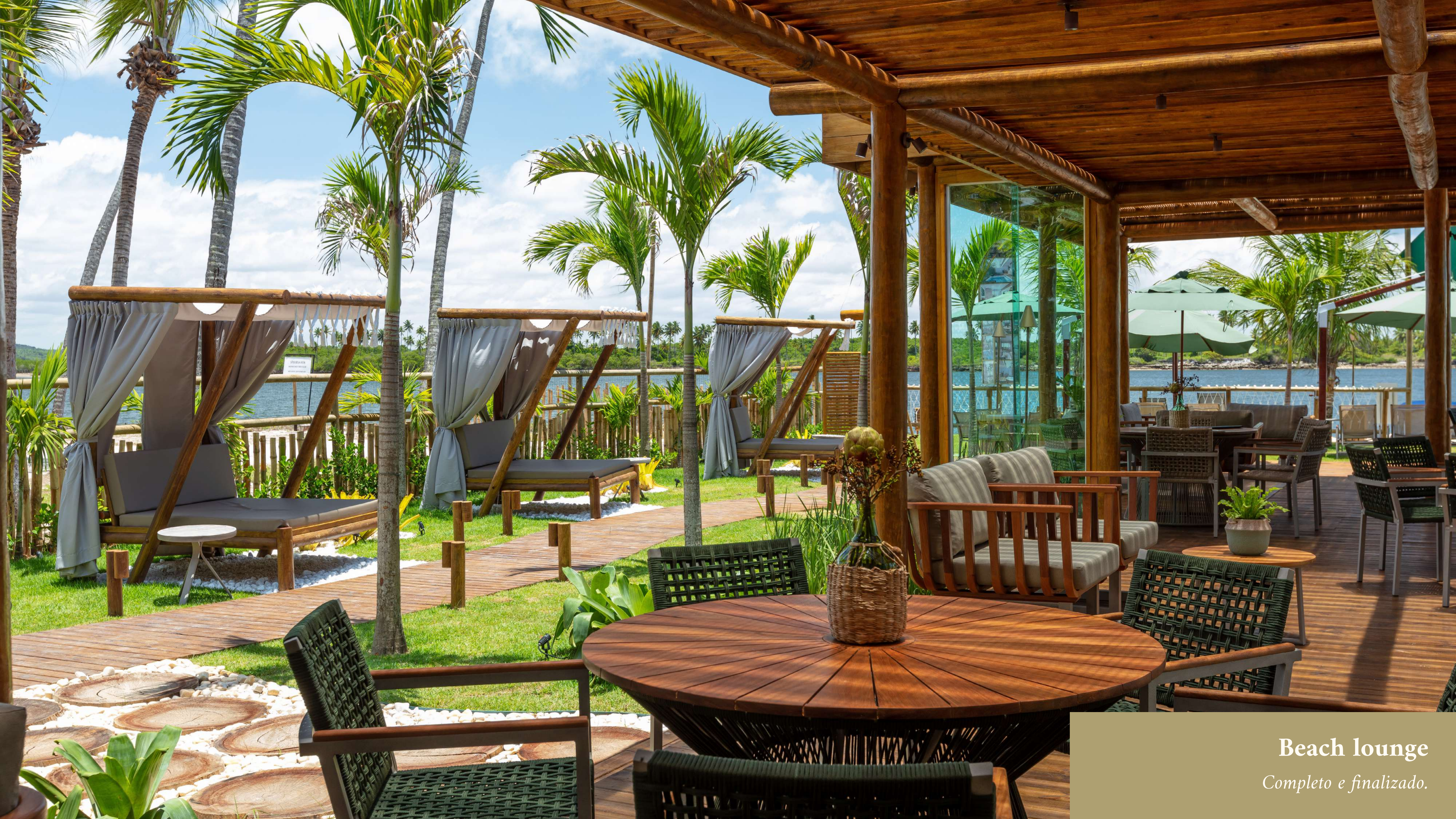
Beach lounge Completo e finalizado.