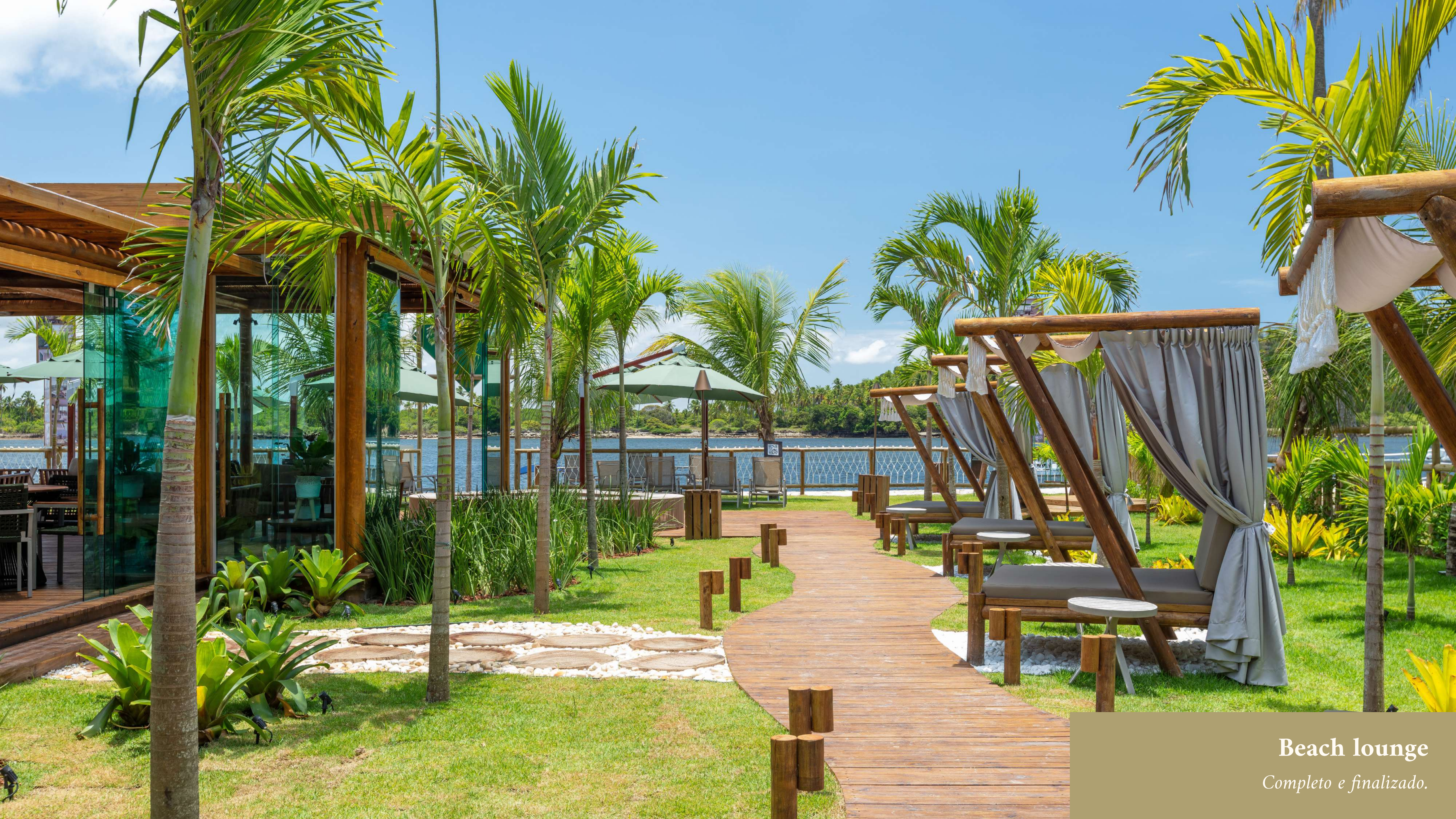
Beach lounge Completo e finalizado.